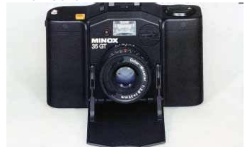
Minox 35 GT

Zeitgleich zu meiner Minolta hatte ich noch eine Minox 35 GT die mich immer dann begleitete wenn ich meine Spiegelreflex nicht mitnehmen konnte.