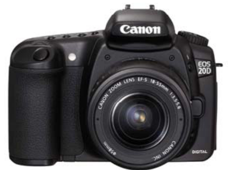
Canon EOS 20D

Begleitend zur Digitalfotografie begann ich mit der Nachbearbeitung der Fotos am Computer. Für mich liegt der Sinn der Fotografie darin, Verschiedene Eindrücke, wie Gefühle, und Zustände zu bewahren. Man soll beim späteren Betrachten der Fotos zum Träumen animiert werden.