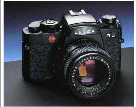
Leica R 5

Dann legte ich eine jahrelange Fotografische Zwangspause ein. Als ich wieder in den Genuss kam, mit dem fotografieren anzufangen, stand ich vor der Entscheidung digital oder analog. Die Vorteile der Digitalfotografie überzeugten mich schnell. Folglich trennte ich mich von meinen analogen Kameras, und kaufte mir eine Digitalkamera.