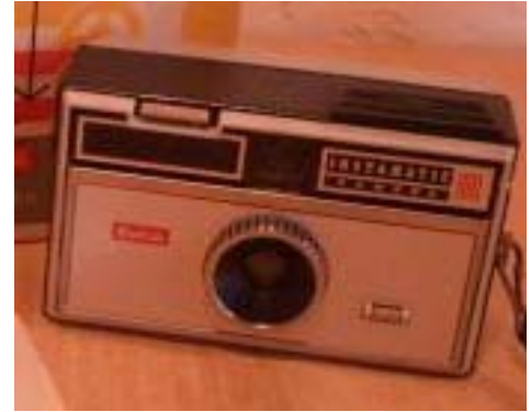
Kodak Instamatic 100 Came

1982 stieg ich, also mit einer „Konica FS1“, in die Spiegelreflexwelt ein. Mit zunehmendem Anspruch an die Qualität der Fotos wuchs der Inhalt meiner Fototasche merklich an, da ich schnell feststellen musste, dass nicht nur die verwendete Kamera, sondern auch das angesetzte Zubehör entscheidend für das Bild ist. Belichtet habe ich ausschließlich nur Dias. Bevorzugtes Filmmaterial war der Kodak Ektachrom 100.